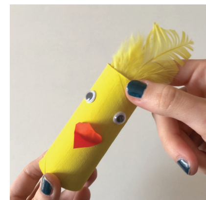
... La crête