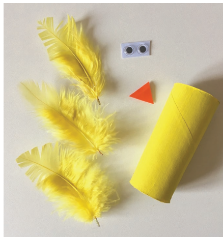
Plier et découper le papier en triangle