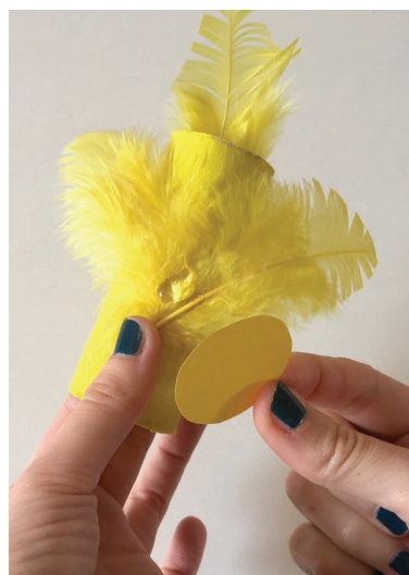
Puis les plumes dans le dos