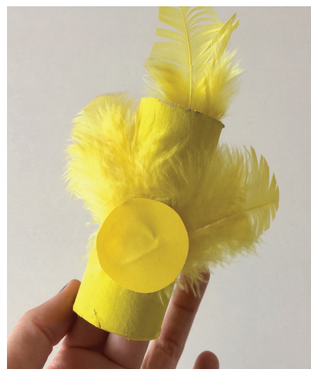
Cacher avec un rond jaune