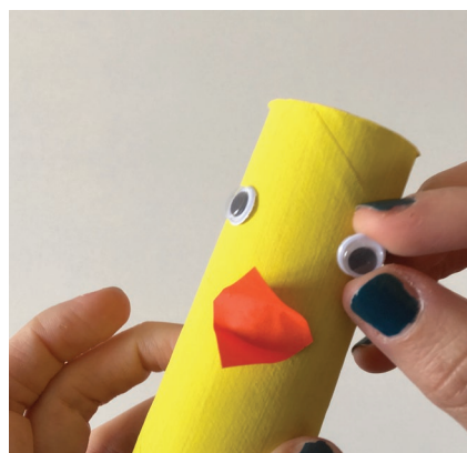
Puis les yeux...