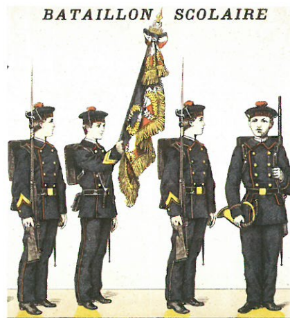
Dessin, fin du XIX e siècle.

Pour préparer la revanche contre l'Allemagne, Jules Ferry prévoit l'organisation de bataillons scolaires. Les enfants doivent suivre une instruction militaire et apprendre le patriotisme.