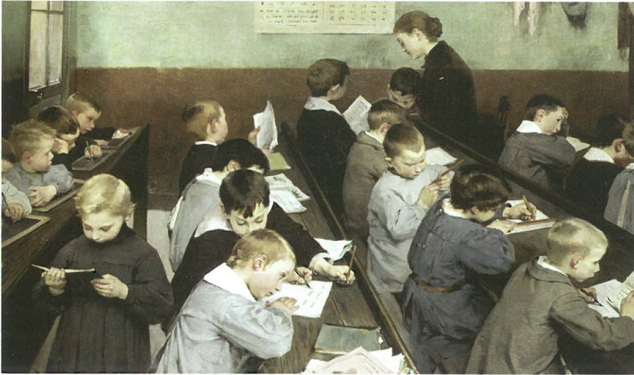
Peinture à l'huile de Henri Jules Jean Geoffroy, XIX e siècle.