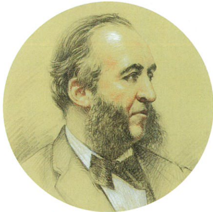
Portrait de Jules Ferry, XIX e siècle.

Jules Ferry (1832-1893) est ministre de l'Instruction publique de 1879 à 1883.