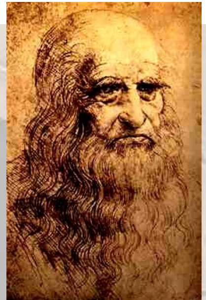
Autoportrait 1512 - 1515

À la fois peintre, sculpteur, architecte, ingénieur et scientifique , ce Florentin est une des grandes figures de la Renaissance . Passionné de connaissance et de recherche scientifique, il a été tout à la fois capable de laisser le tableau le plus célèbre du monde et des « inventions » qui n'ont été menées à bonne fin que quelques siècles plus tard.