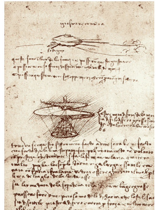
Page du manuscrit B de Léonard de Vinci concernant des projets de machines volantes En bas : le dessin d'un hélicoptère

Parmi ces plus célèbres inventions, on trouve : parachute , hélicoptère , char d'assaut , palan , engrenage , manivelle , roue dentée , etc.