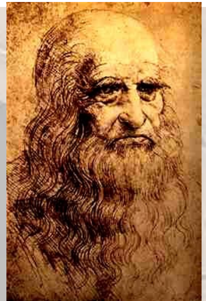
Autoportrait 1512 - 1515

À la fois peintre, sculpteur, architecte, ingénieur et scientifique , ce Florentin est une des grandes figures de la Renaissance . Passionné de connaissance et de recherche scientifique, il a été tout à la fois capable de laisser le tableau le plus célèbre du monde et des « inventions » qui n'ont été menées à bonne fin que quelques siècles plus tard.