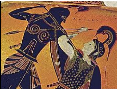
L'Iliade raconte la guerre de Troie

L' Iliade une épopée attribuée au poète Homère. Elle est divisée en 24 chants. Le texte a probablement été rédigé entre 850 et 750 av. J.-C. , soit quatre siècles après la période à laquelle les historiens font correspondre la guerre mythique qu'il relate.